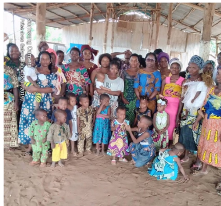
Envoi des agents de la PPE sur la paroisse Saint Ambroise de Lokpo- sur le lac- chemin difficile et accès final par l'eau.