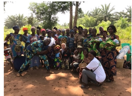
Sensibilisation Paroisse Saint Étienne sur les Communautés de Base