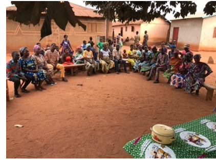
Célébrations de vie et rencontres- sur les paroisses de St-Paul de Adovie et Tangbo