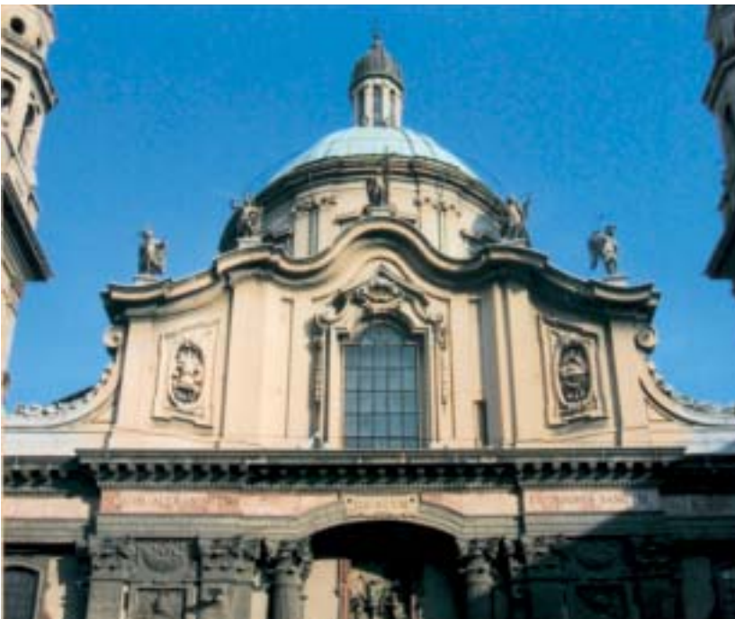
Mailand; Kirche des Hl. Alessandro: oberer Teil der Fassade.