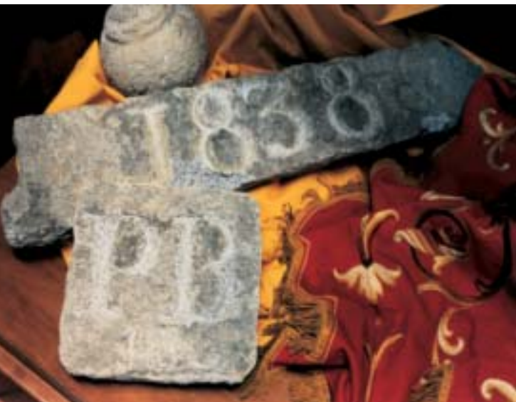
Der Grundstein des ersten Internats der Marcellinen in Cernusco sul Naviglio.