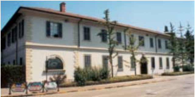
Außenfassade des ersten Internats in Cernusco sul Naviglio.