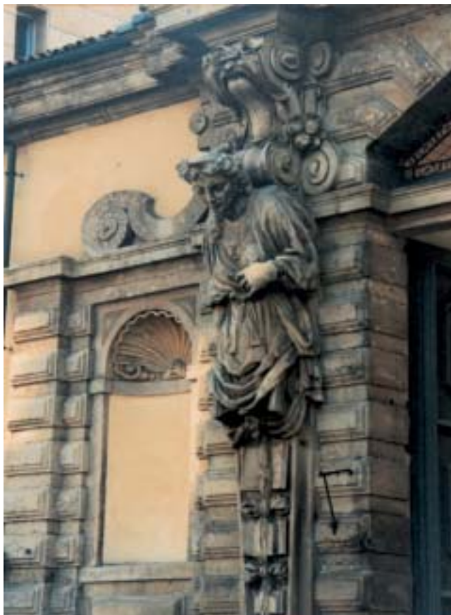
Die Karyatide. Detail im Eingangsbereich des Priesterseminars in Mailand.