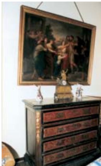
Antike Kommode im Wohnzimmer.