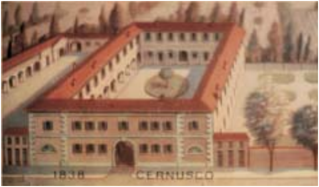
Alte Darstellung des ersten Internats.