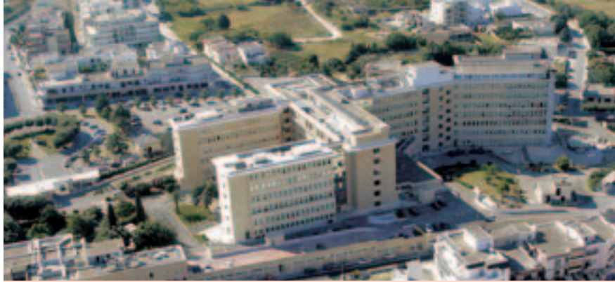
AZIENDA OSPEDALIERA CARD. G.PANICO CON ANNESSO POLO DIDATTICO UNIVERSITARIO - TRICASE (LECCE)