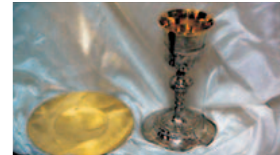
CALICE E PATENA DELLA PRIMA MESSA DI BIRAGHI.

sua salda fede nel primato della Chiesa di Roma gli fu offerta dalle discussioni conciliari preparatorie alla costituzione dogmatica Pastor Aeternus , che di lì a poco (18 luglio 1870) avrebbe affermato anche la dottrina dell'infallibilità del Papa, quando questi parla ex cathedra in materia di fede e di morale. Biraghi si fece sentire, ancor prima della definizione ufficiale, con una Lettera sull'infalibilità, apparsa ne L'Osservatore Cattolico del 6 aprile 1870. In questo scritto si incontra ancora una volta il Biraghi di sempre: l'uomo di pace, che cerca di fare chiarezza, che mira con calma sapiente a fare luce, a riconci-